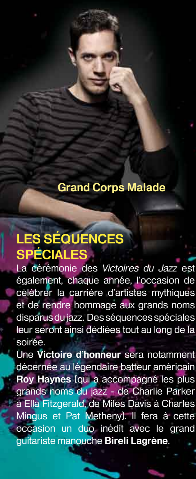
Grand Corps Malade